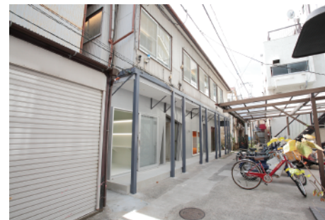
外観 / Outside View