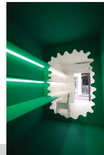
内観 / Inside View (参考 / Reference photo)