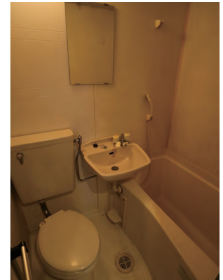
シャワー、トイレ Shower room, Toilet