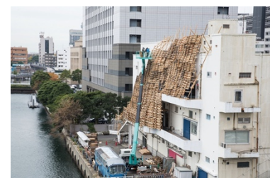
参考写真《Expand BankART》 BankART Studio NYK/ 横浜、2012