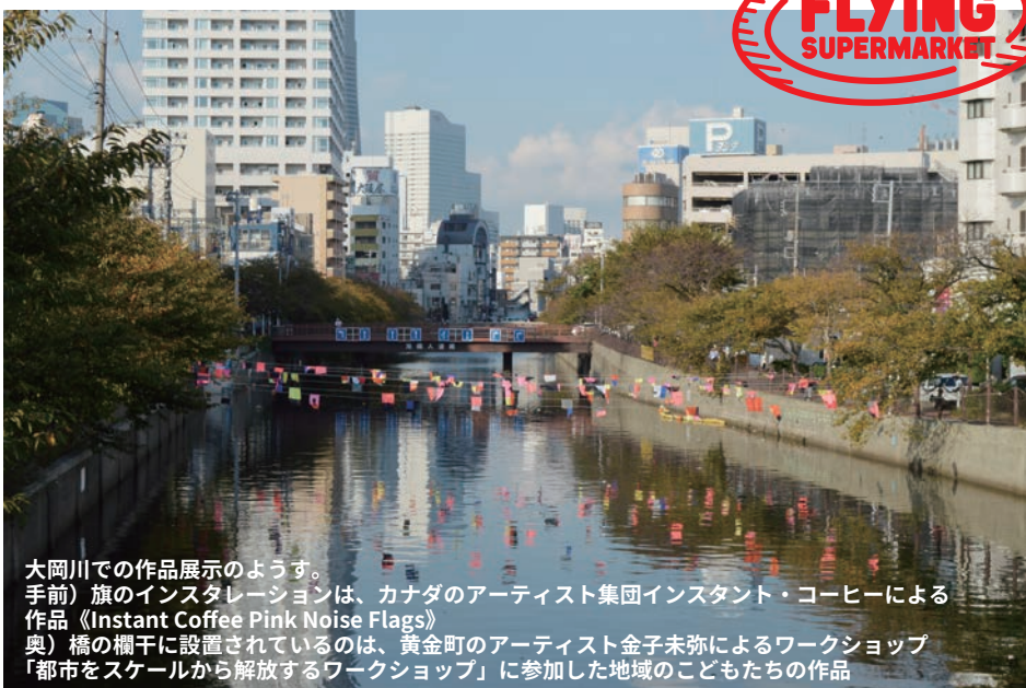
大岡川での作品展示のようす。手前）旗のインスタレーションは、カナダのアーティスト集団インスタント・コーヒーによる作品《Instant Coffee Pink Noise Flags》奥）橋の欄干に設置されているのは、黄金町のアーティスト金子未弥によるワークショップ「都市をスケールから解放するワークショップ」に参加した地域のこどもたちの作品