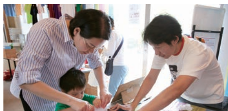
週末は来場者が参加できるワークショップが多数。葉栗翠+イクタケマコトはシルクスクリーン体験を実施し、世界でひとつだけの作品を気軽に制作できる