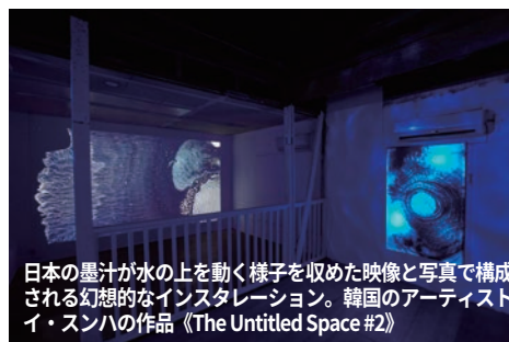
日本の墨汁が水の上を動く様子を収めた映像と写真で構成される幻想的なインスタレーション。韓国のアーティストイ・スンハの作品《The Untitled Space #2》