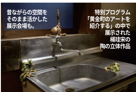
昔ながらの空間をそのまま活かした展示会場も。