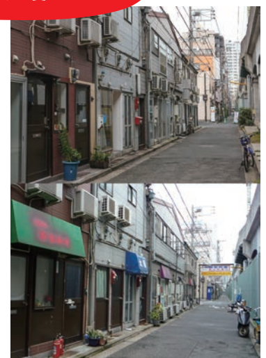
「フライング・バック・ウィンドウ・ギャラリー」より 同じ構図で撮影した2018年のまちの風景（上）と 2010年のまちの風景（下）

日時：10月21日（日）15:00～16:30 会場：高架下スタジオ Site-D 集会場（横浜市中区黄金町1-2 番地先） 登壇者：ツァイ・ケンリン（黄金町バザール 2010/ 黄金町バザール 2018 参加アーティスト） 山野真悟（黄金町バザール ディレクター） モデレーター：水谷朋代（黄金町エリアマネジメントセンター） 入場料：黄金町バザール 2018 チケット（700円）の提示が必要 定員：30名