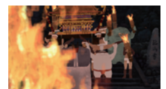
谷耀介《くらまの火祭り》2017年 © 2017 Yosuke TANI / Tokyo University of the Arts