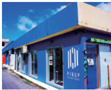
PIN-UP Gallery / © Moriya Kyoda