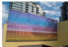
インスタント・コーヒー 《Perpetual Sunset / Say Nothing in Bright Colours》2012年