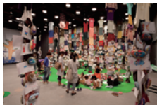
安部泰輔 ワークショップ 「ふしぎの森の美術館」2010年