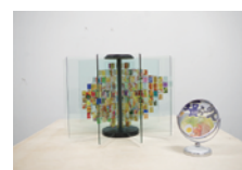
メランカオリ 《鏡色の研究》2017年