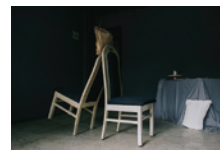
ファイ・ティエン・ムイエン 《Belonging 1.02!》2018年