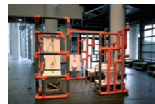
蔡坤霖 (ツアイ・クエンリン) 《伏流 II》2013年