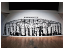
スピーク・クリプティック 《State of Decline》2018年