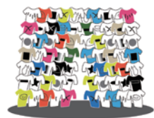
葉栗翠+イクタケマコト 黄金町バザール 2018 展示イメージ画像