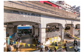
黄金町バザール 2017 開催風景