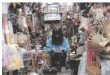
エスクリ フィリピン・バギオでの パフォーマンス風景, 2016年