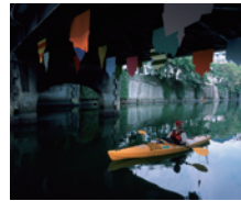
本間純《そして川は流れる》 黄金町バザール 2008