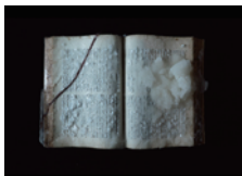
山本アンディ 彩果 《エターナル・ストーリー》 2016年～