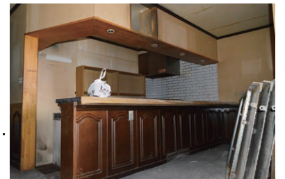
C. レジデンススペース提案募集物件

当該地区で活動するアーティストやクリエイターが滞在制作を行うことができる空間のデザインを募集する。黄金町バザール 2015 期間は空間作品として展示・公開し、その後、レジデンス希望者を公募し活用していく。