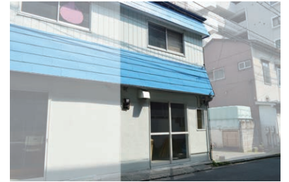
A. インフォメーション提案募集物件

当該地区のまちづくりの活動をインフォメーションする空間デザインを募集します。 『黄金町バザール 2015』会期中は、会場スタッフまたはサポーターの活動場所として利用するとともに、積極的にまちのインフォメーションを行う場所として公開し、『黄金町バザール 2015』終了後は、地域防犯拠点「ステップ・ワン」と連動した活用展開ができるよう、その提案を募集します。